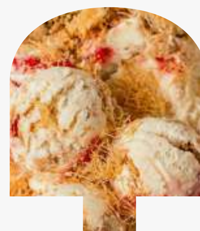
STRAWBERRY CHEESECAKE KUNafa